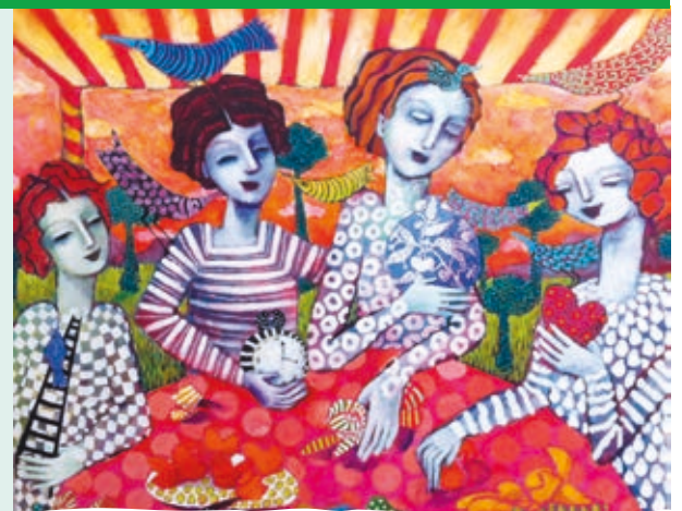
TERESA ORTÚZAR "Las Cosas Importantes", acrílico, 2015

ENCUENTRO 2019 SUR mujer® LAS FORMAS DEL AMOR